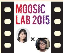
MOOSIC LAB コラボイベント