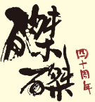
「京都磔磔40周年記念ライブ」