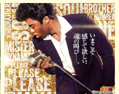
ジェームス・ブラウン