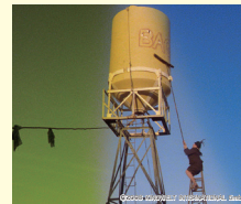
パクダッドカフェ