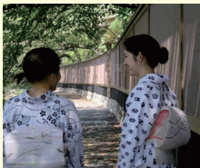
カントリーガール