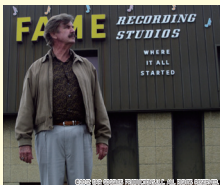
黄金のメロディ マッスル・ショールズ